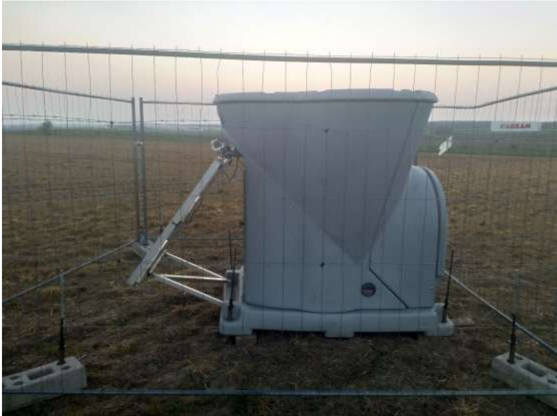
Photographie d'un sodar

Question : « Quels chemins seront empruntés dans le cadre du projet ? »